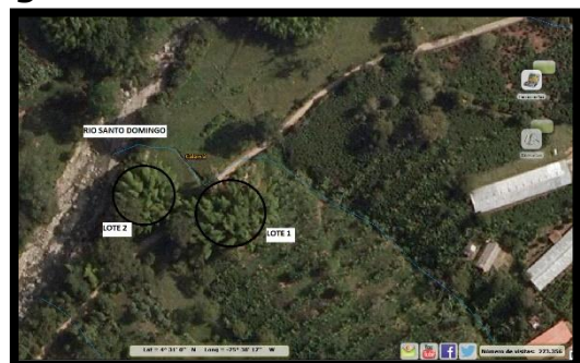
Imagen N° 3. Lotes a intervenir.