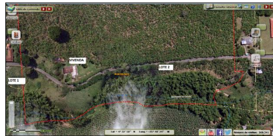
Imagen N° 2. Lotes a intervenir.