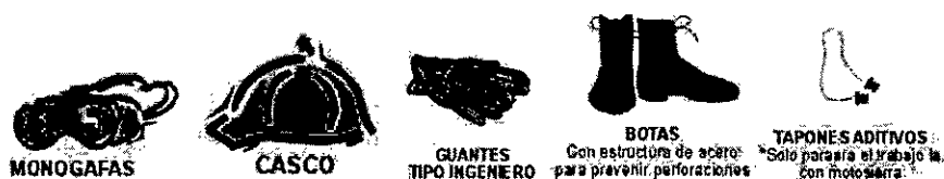
Figura 4. Elementos de protección personal.

Elementos de protección personal. Están diseñados para proteger al trabajador de peligro a su salud y seguridad personal, que no pueden ser eliminados del área de trabajo. Se debe realizar mantenimiento periódico, limpiar y desinfectar además de revisar su estado.