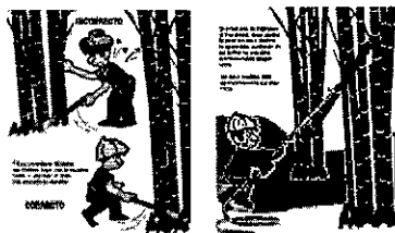
Figura 1. Corte o apeo de la Guadua.

Transporte interno. Implementando transporte con bestia, extracción al hombro o usando camionetas de carga, tractores, entre otros, los cuales movilizan los productos hasta el punto de acopio o el sitio de carga del camión.