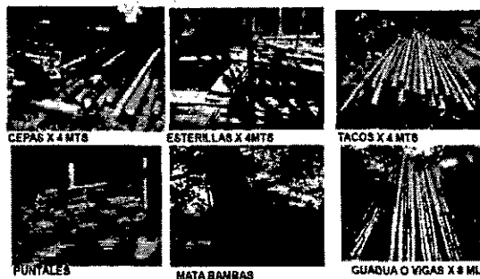
Figura 6. Productos comerciales de la Guadua.