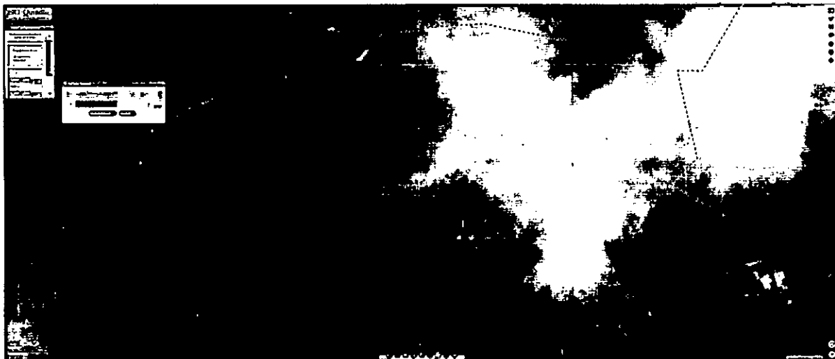
Figura 1. Consulta predial. Fuente. GEO – PORTAL DEL IGAC FINCA LA DANIELA identificado con la ficha catastral 631300001000000050179000000000 y matricula inmobiliaria N° 282-30310 , ubicado en la vereda PRADERA ALTA del Municipio de CALARCÁ del departamento del QUINDIO .

El predio rural denominado FINCA LA DANIELA identificado con la ficha catastral N° 631300001000000050179000000000 y matricula inmobiliaria N° 282-30310 , ubicado en la vereda PRADERA ALTA del Municipio de CALARCÁ del departamento del QUINDIO , el cual cuenta con un área de terreno de 18 HECTÁREAS (HA) con 4.576 METROS CUADRADOS (M 2 ) , según consta en el certificado de tradición aportado para el trámite.