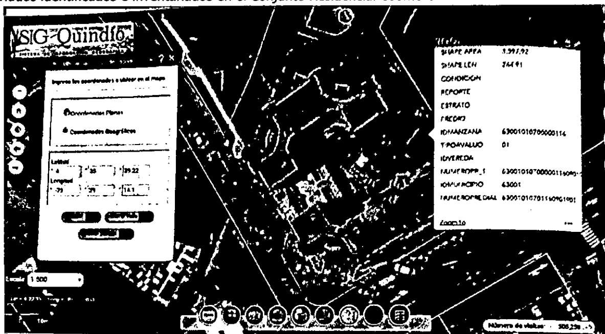
Imagen 1: Captura de pantalla de la consulta efectuada en el aplicativo SIG Quindío. Ubicación Individuos identificados e inventariados en el Conjunto Residencial Coomeva.