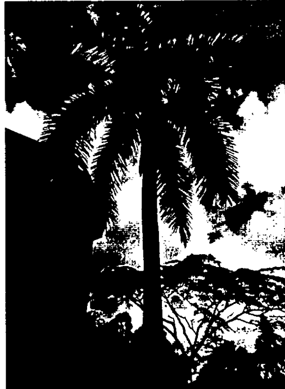
Foto N° 1 Palma Botella – Costado Derecho Foto N° 2 Palma Botella Costado Izquierdo

20.01.2023 14:35 4°33'30.95"N 75°39'14.38"O Cl. 23a Nte. #14-74, Armenia, Quindío