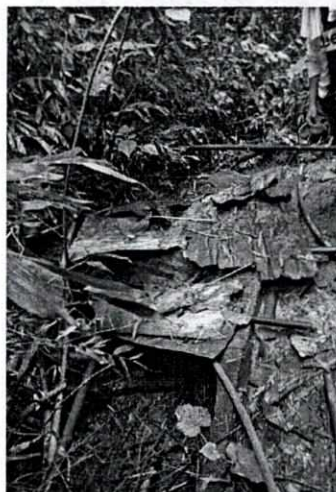
Fotografía 1. Captación del sistema