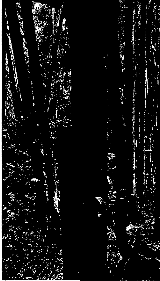
Fotografía No. 1 y No. 2 verificación de puntos de levantamiento planimétrico en el guadual.