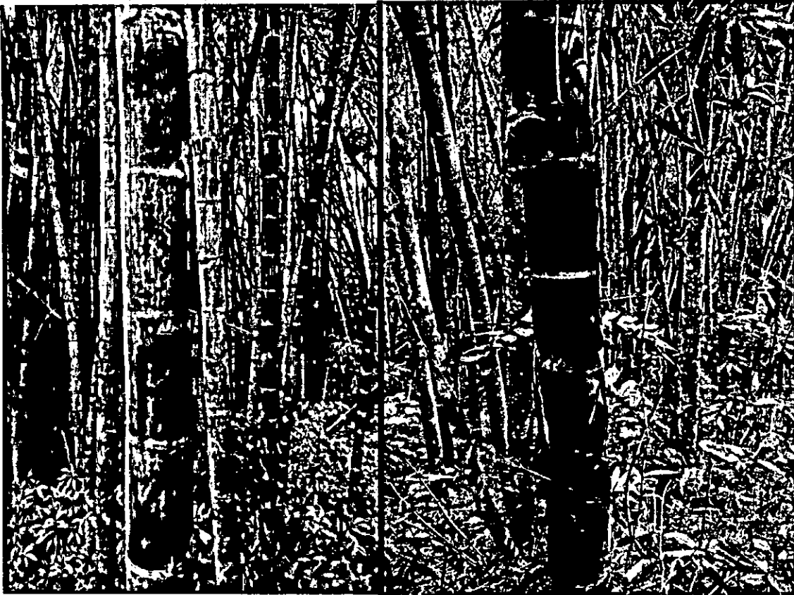
Fotografía No. 3 y No. 4 verificación de la ubicación de las parcelas y el inventario forestal.