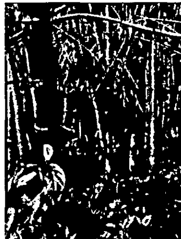
Fotografía 1, 2 y 3. verificación de puntos de levantamiento planimétrico en el guadua.