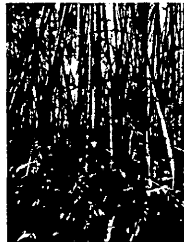
Fotografía 4, 5 y 6. verificación de puntos de levantamiento planimétrico en el guadua.