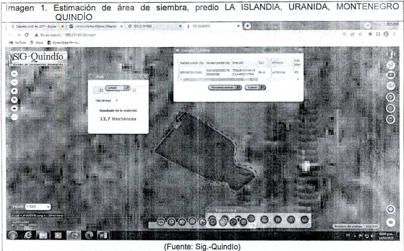
Imagen 1. Estimación de área de siembra, predio LA ISLANDIA, URANIDA, MONTENEGRO QUINDÍO

El lote para establecimiento de cultivo, cuenta con una extensión de aproximadamente 13,7 hectáreas, se encuentra bajo coberturas herbáceas (pastos).