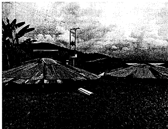
Fotografía 1. Captación y almacenamiento