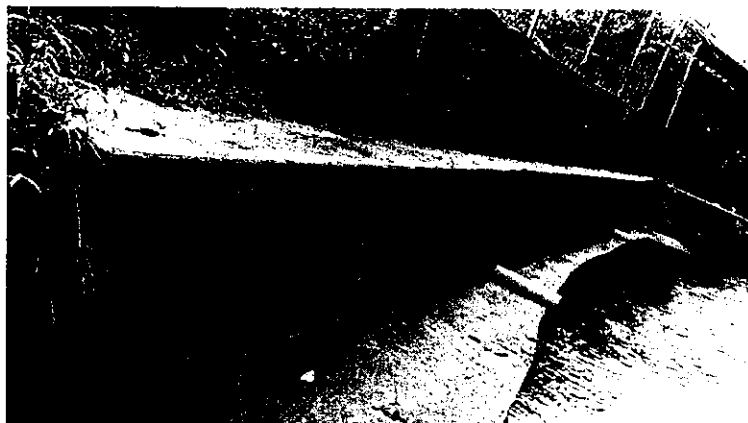
Fotografía 2. Muro de contención construido

Se realizó nueva visita en compañía con el propietario del predio lote 48, condominio Los Almendros el día 20 de febrero de 2023, en la cual se verificó el muro de gaviones construido y su ubicación, muro localizado sobre la quebrada del Macho. En la siguiente fotografía se presenta el sitio identificado en la visita en donde se construyeron las obras descritas que requieren ocupación de cauce.