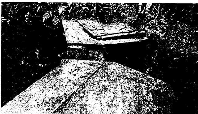
Captación La Carolina

La primer captación se localiza en el predio La Carolina, de la estructura de captación el agua es conducida por medio de tubería de 2 ½" de diámetro; la segunda captación se localiza sobre la quebrada La Venecia, de allí el agua es conducida por tubería en 3" de diámetro; la tercer captación localizada en el predio La Rivera, en este punto se recolecta el caudal captado por las tres bocatomas e ingresa al desarenador del sistema, en este punto se realiza el retorno de excesos al cauce.