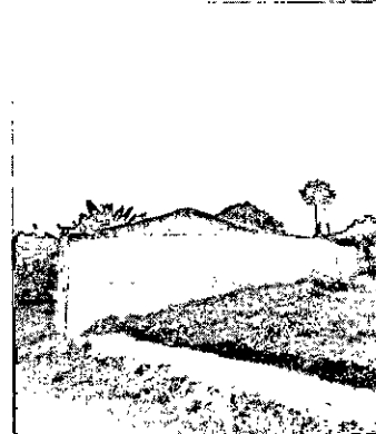
Fotografía 1. Captación y almacenamiento