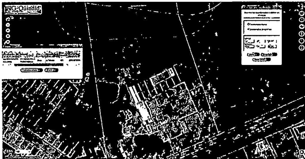
Imagen 2. Localización del predio.

Uso prohibido: vivienda en general, institucional, comercial Grupos (4) y (5 tipo (A) social tipo (A). grupo 1 tipo B grupo (1), recreacional Grupo (2)