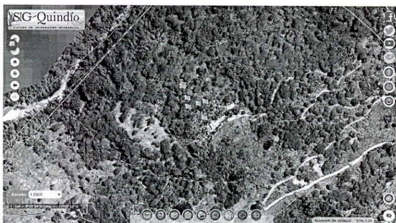
Figura 2. Verificación y ubicación de los puntos tomados en campo de los árboles dentro del predio.