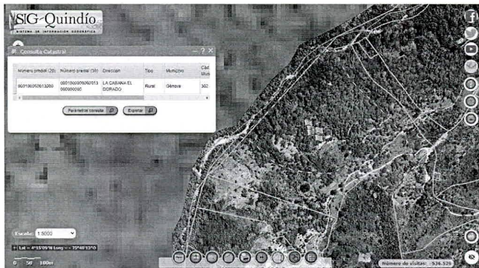
Figura 1 Consulta Catastral.