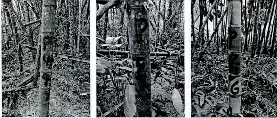
Fotografía 1, 2 y 3. Verificación de puntos de levantamiento planimétrico en el guadual.