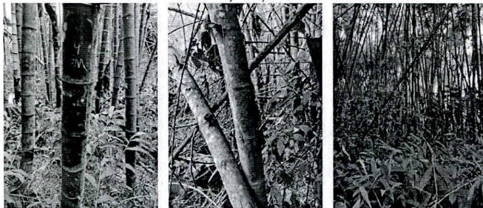
Fotografía 4, 5 y 6. Verificación de puntos de levantamiento planimétrico en el guadual.