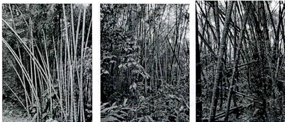
Fotografía 7, 8 Y 9. Estado del guadual previo al aprovechamiento.