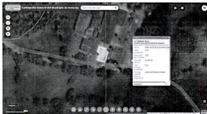
Figura 2. Verificación y ubicación de los puntos tomados en campo de los árboles dentro del predio.

A continuación, se presenta la consulta de las coordenadas tomadas en el predio: