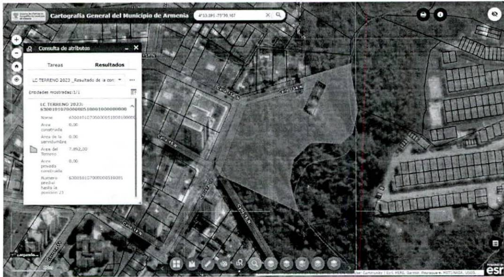
Figura 4 Consulta Catastral.