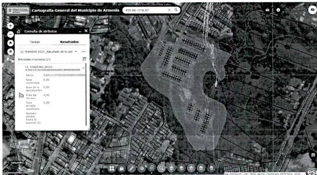
Figura 1 Consulta Catastral.

NOMBRE DEL PREDIO: FRENTE A LA AVENIDA CENTENARIO KR 6 # 17 NORTE - 20