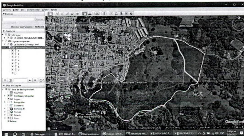
Imagen 2 Ubicación del predio LA ROCHELA, vereda LA ROCHELA del municipio de Quimbaya, consulta catastral.