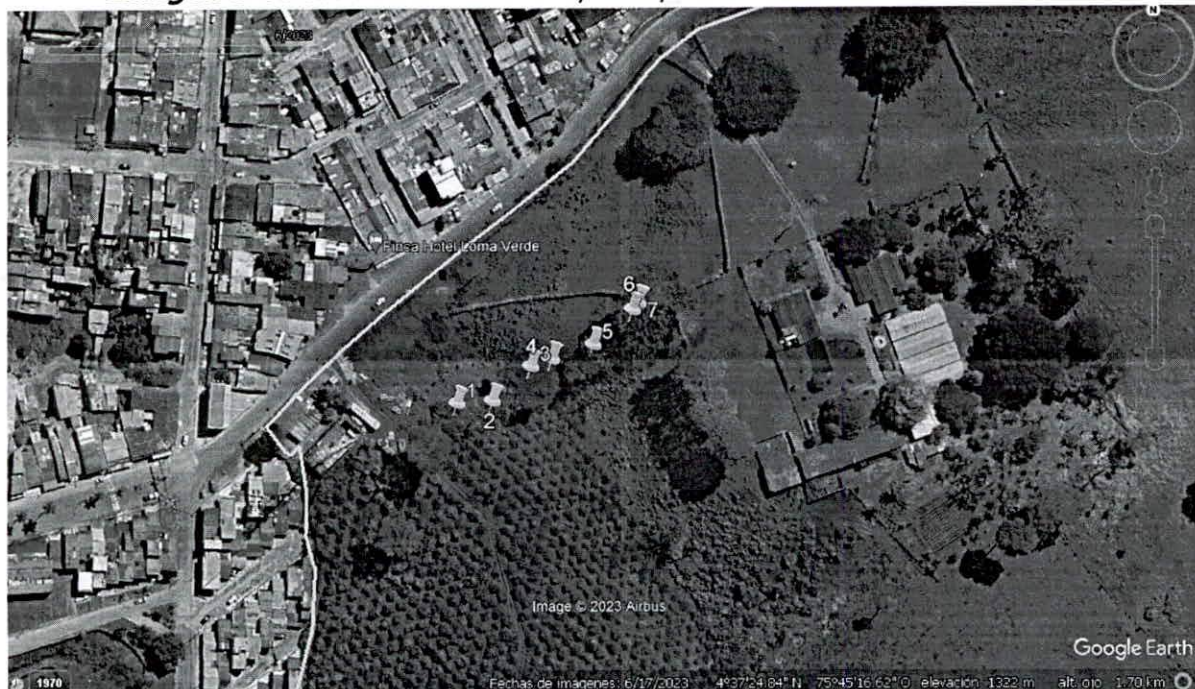
Imagen 3 Ubicación de los árboles para aprovechamiento de árbol aislado

Verificación y ubicación de los puntos tomados en campo de los árboles de la solicitud de aprovechamiento forestal de árbol aislado.