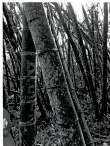
Fotografía 7, 8 y 9. verificación de puntos de levantamiento planimétrico en el guadual.