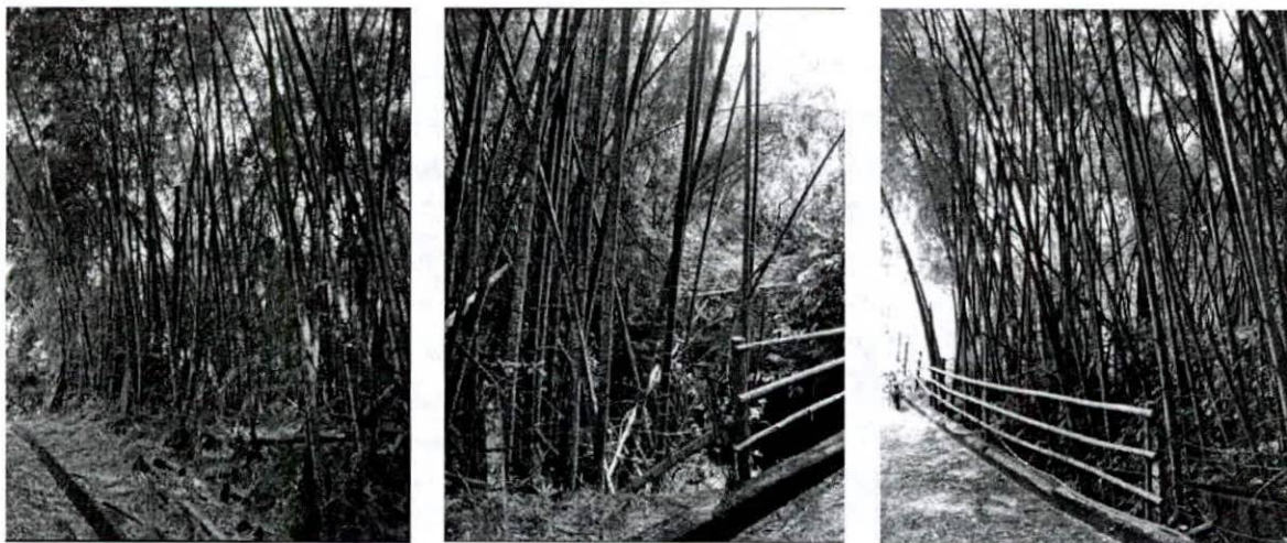
Fotografía 1, 2 y 3. verificación de puntos de levantamiento planimétrico en el gradual.