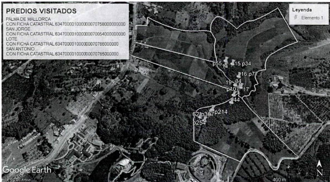
Verificación De Coordenadas de Puntos De Levantamiento 2023.