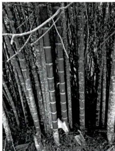
Fotografía 4, 5 y 6. verificación de puntos de levantamiento planimétrico en el guadual.