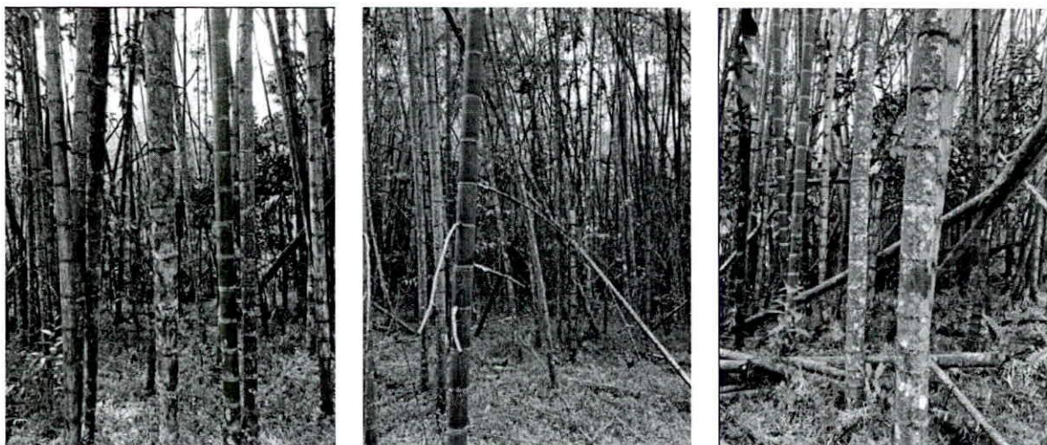
Fotografía 13, 14 Y 15. verificación de puntos de levantamiento planimétrico en el guadua.