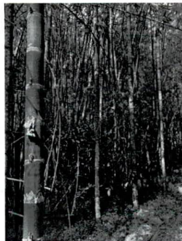
Fotografía 10, 11 Y 12. verificación de puntos de levantamiento planimétrico en el guadual.