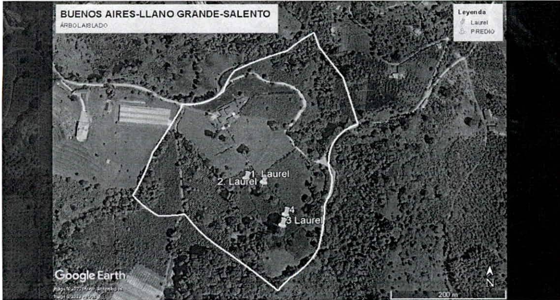
Imagen 3 Ubicación de los árboles para aprovechamiento de árbol aislado

Verificación y ubicación de los puntos tomados en campo de los árboles de la solicitud de aprovechamiento forestal de árbol aislado.