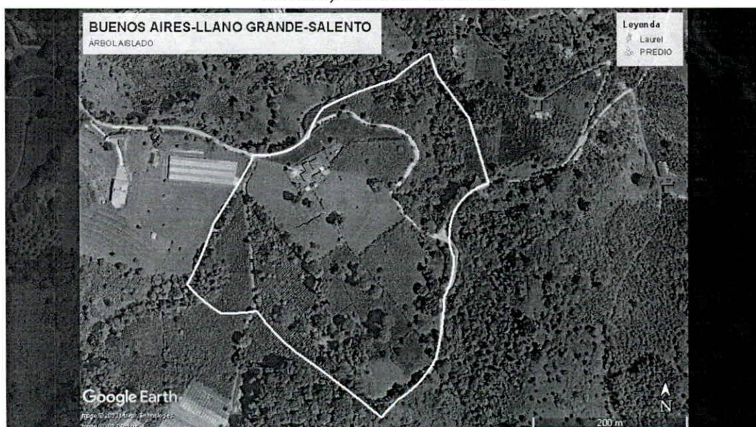
Imagen 2 Ubicación del predio BUENOS AIRES, vereda Llano Grande del municipio de Salento, consulta catastral.