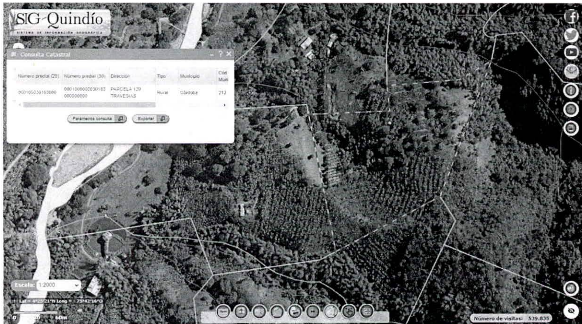
Figura 1 Consulta Catastral.