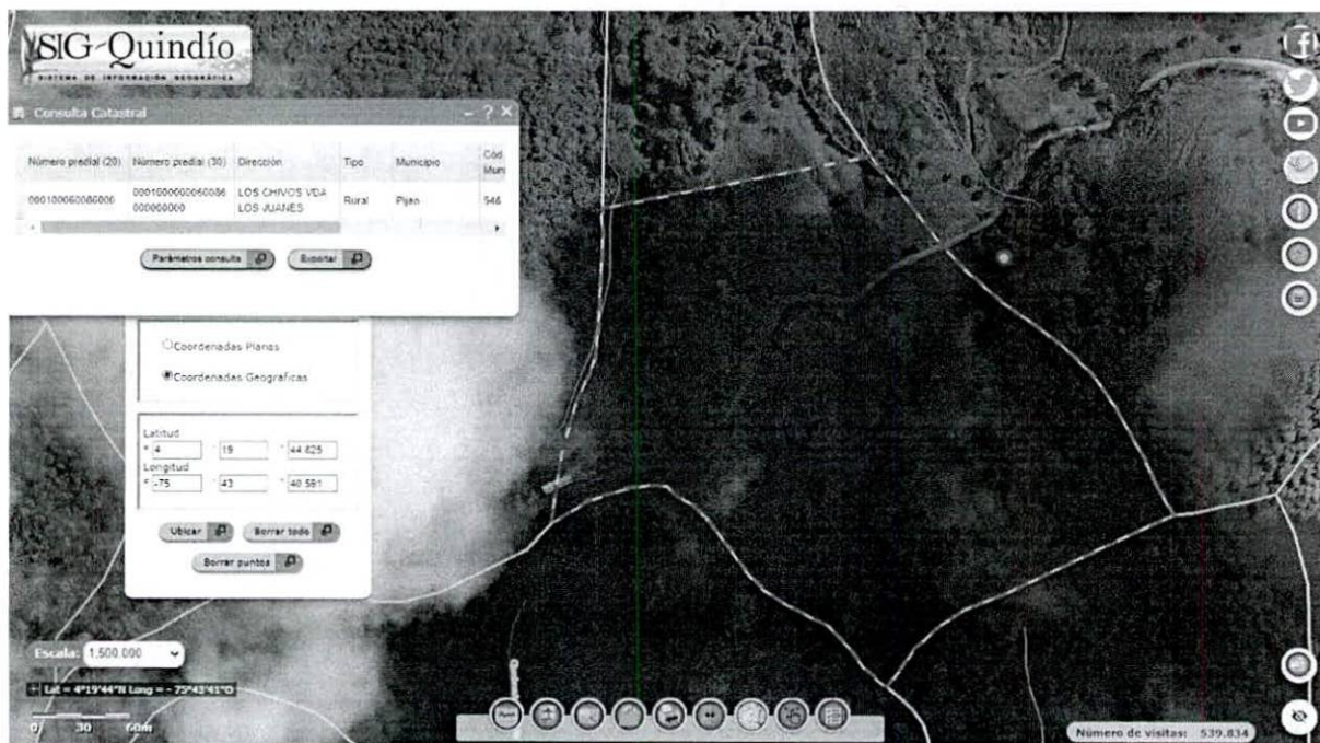
Figura 2. Verificación y ubicación de los puntos tomados en campo de los árboles dentro del predio.

A continuación, se presenta la consulta de las coordenadas tomadas en el predio: