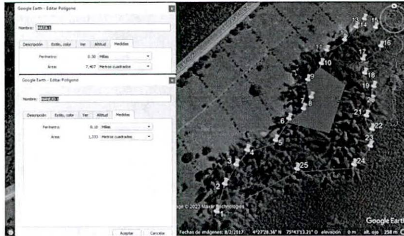
Figura 3. Puntos de levantamiento MATA 1.