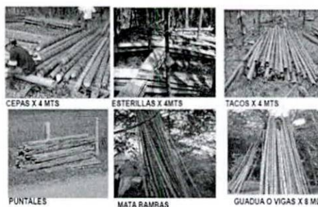
Figura 11. Productos comerciales de la Guadua.