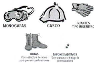
Figura 8. Elementos de protección personal.

Elementos de protección personal. Están diseñados para proteger al trabajador de peligro a su salud y seguridad personal, que no pueden ser eliminados del área de trabajo. Se debe realizar mantenimiento periódico, limpiar y desinfectar además de revisar su estado.