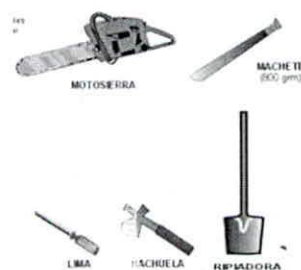
Figura 9. Herramientas.

Herramientas utilizadas en el proceso. Las herramientas mecanizadas como la motosierra, deben tener una revisión periódica y mantenimiento preventivo y correctivo por seguridad del trabajador. Las herramientas manuales se deben revisar y afilar periódicamente. Las herramientas se deben utilizar adecuadamente para cada tipo de operación.