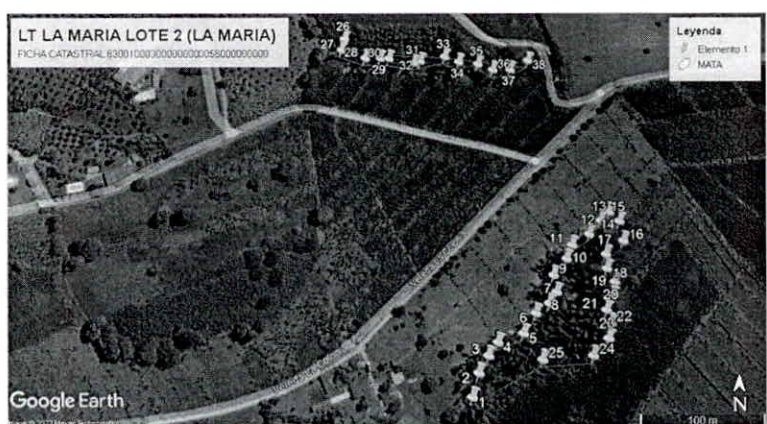
Figura 2. Consulta predial.