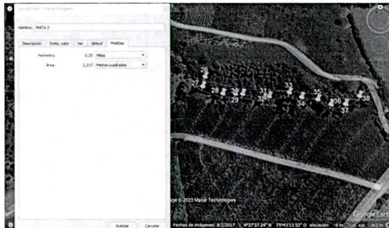
Figura 4. Puntos de levantamiento MATA 2.