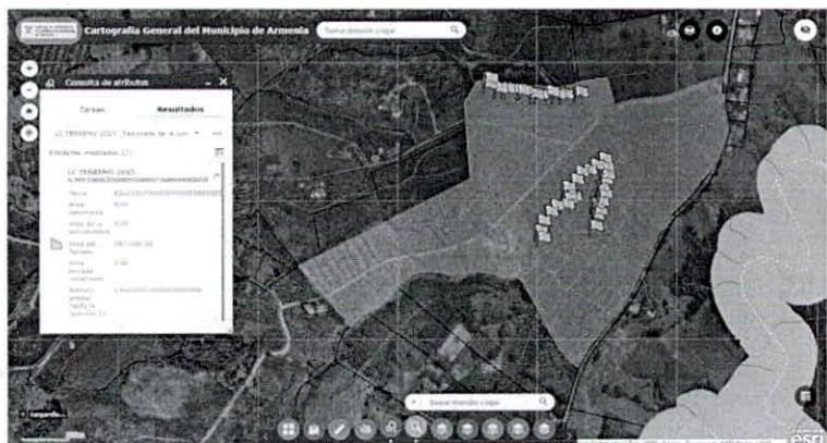
Figura 1. Consulta predial.