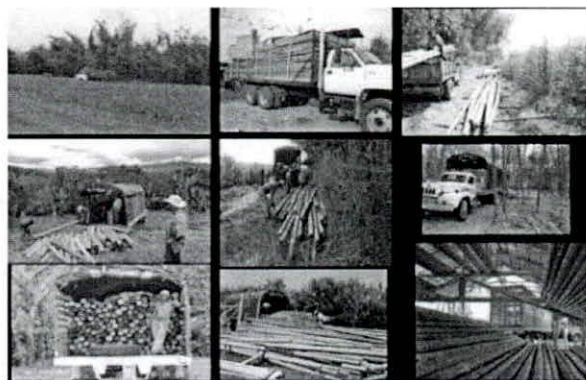
Figura 7. Transporte externo.

Transporte externo. Se carga los productos no maderables en camiones de dos y tres ejes, los cuales movilizan la guadua hasta el sitio de disposición final.