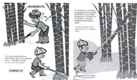
Figura 5. Corte o apeo de la Guadua.

Transporte interno. Implementando transporte con bestia, extracción al hombro o usando camionetas de carga, tractores, entre otros, los cuales movilizan los productos hasta el punto de acopio o el sitio de carga del camión.