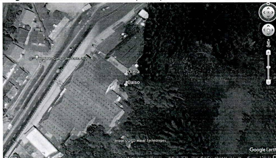
Imagen 3 Ubicación de los árboles para aprovechamiento de árbol aislado

Verificación y ubicación de los puntos tomados en campo de los árboles de la solicitud de aprovechamiento forestal de árbol aislado.