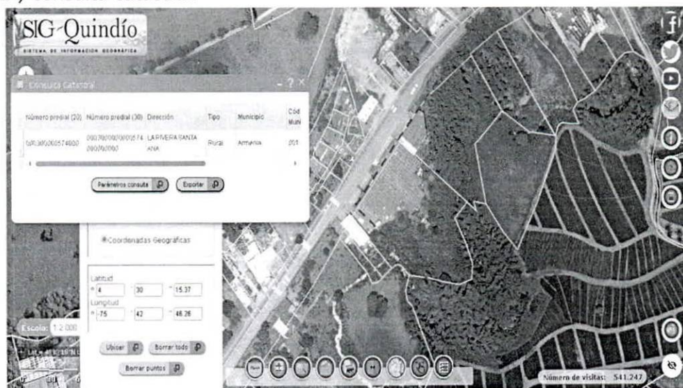
Imagen 1 Ubicación del predio LT 1 LA RIVERA, vereda SANTA ANA del municipio de ARMENIA, consulta catastral.

ÁREA: tiene una extensión de 15534 METROS CUADRADOS