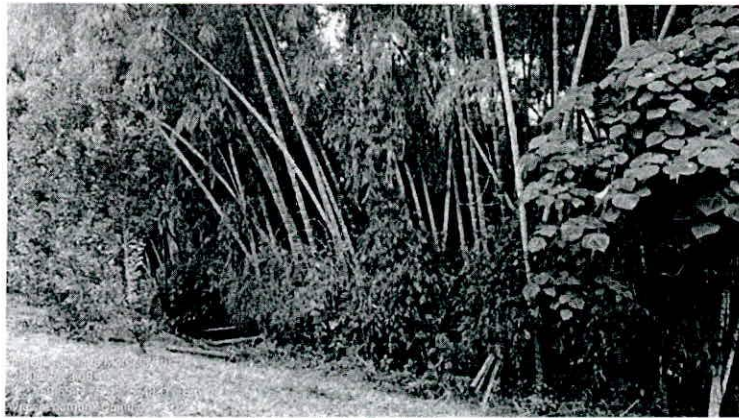
Fotografía 5. Perfil del guadual