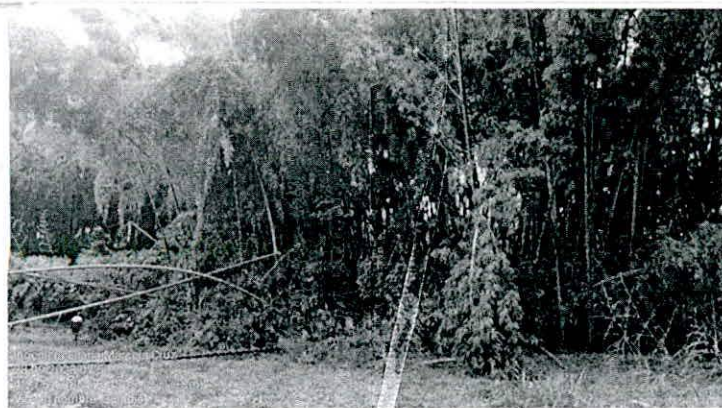
Fotografía 6. Densidad del Guadual