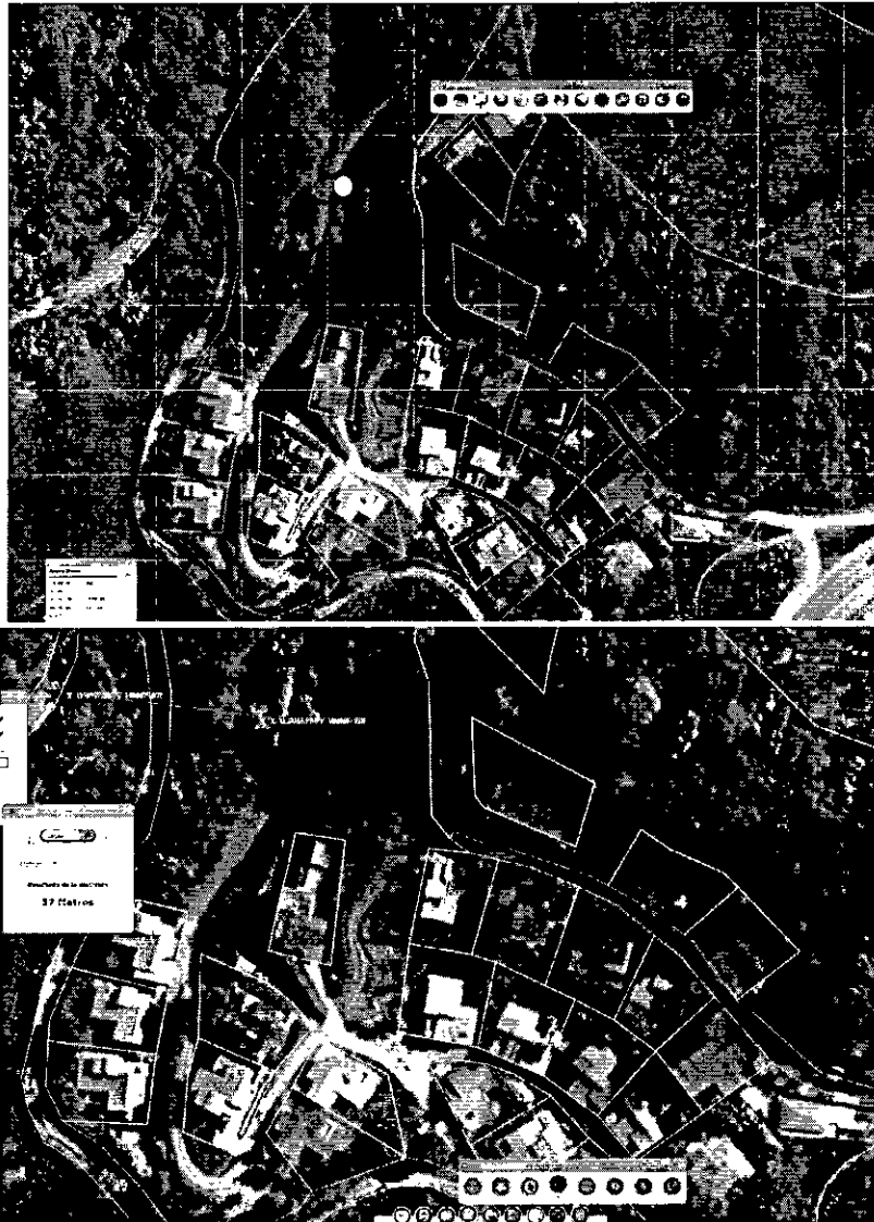
1Tomado del SIG Quindío.

"POR MEDIO DEL CUAL SE NIEGA UN PERMISO DE VERTIMIENTO DE AGUAS RESIDUALES DOMÉSTICAS PARA EL PREDIO 1) LOTE Y CASA CHALETURBANIZACION QUINTAS DEL BOSQUE VEREDA LA FLORIDA MUNICIPIO DE CIRCASIA" Y SE ADOPTAN OTRAS DISPOSICIONES"