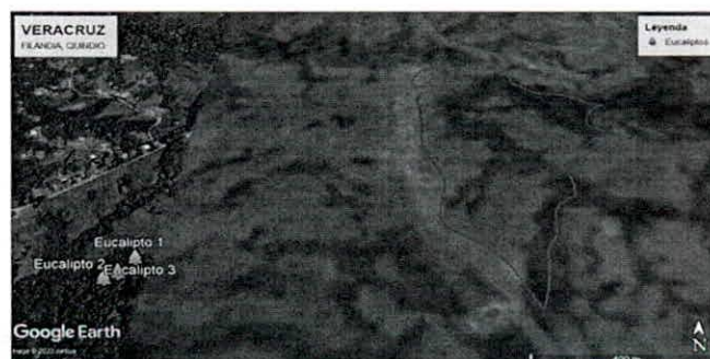
Imagen 2 Ubicación de los individuos arbóreos al interior de un predio que no es "VERACRUZ" del municipio de FILANDIA, consulta catastral.

En la imagen 2 se refleja geográficamente el polígono correspondiente al predio VERACRUZ perteneciente al municipio de FILANDIA, vereda CRUCES y la ubicación de los individuos arbóreos registrados en la visita. Teniendo en cuenta esta imagen se determina que dichos individuos NO PERTENECEN al predio objeto de solicitud.