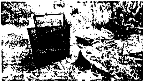
Fotografía 1. Captación del sistema

La captación se realiza de manera directa a través de tubería directa con represa en el cauce, se encuentra instalada una rejilla artesanal para detener el paso de sólidos.