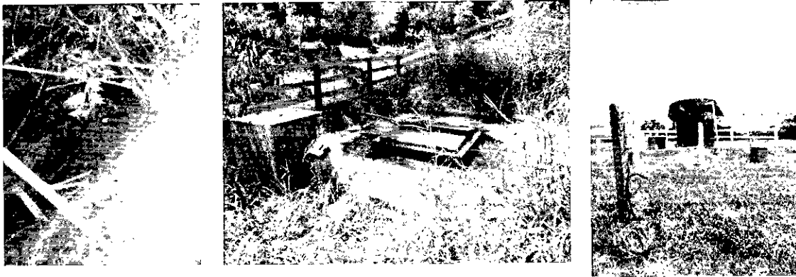
Fotografía 1. Captación del sistema y almacenamiento

"POR MEDIO DE LA CUAL SE OTORGA CONCESIÓN DE AGUAS SUPERFICIALES PARA USO PECUARIO A LA SOCIEDAD INVERSIONES GUACIMAL S.A.S – EXPEDIENTE ADMINISTRATIVO No. 10352 -23"