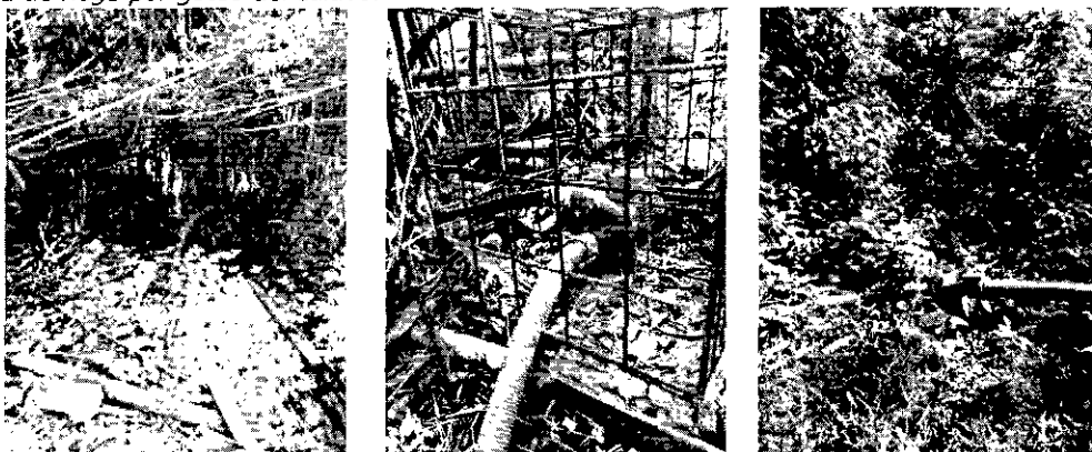
Fotografía 1. Captación del sistema y riego cultivo

La captación se realiza de manera directa por medio de válvula granada y tubería de succión para ser bombeada el agua hasta el sistema de riego por goteo del cultivo.