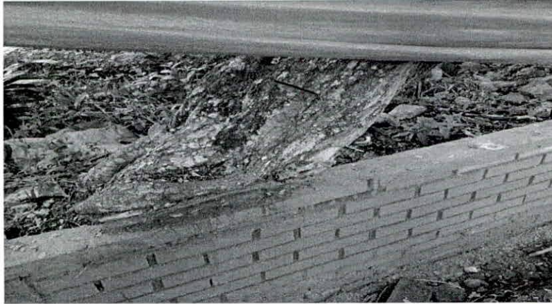
Figura N° 3 Especie Payande contiguo al muro en construcción.