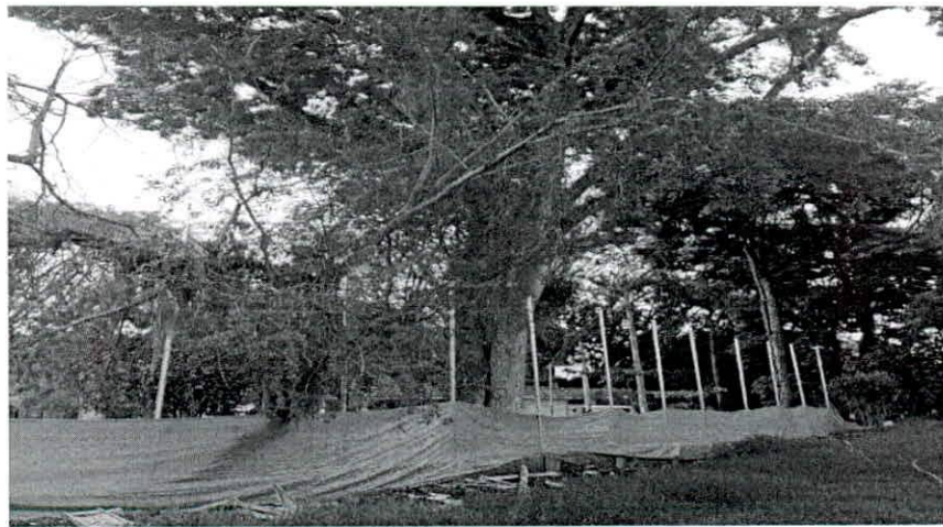
Figura N° 1. Especie PAYANDE objeto de intervención mediante tala.