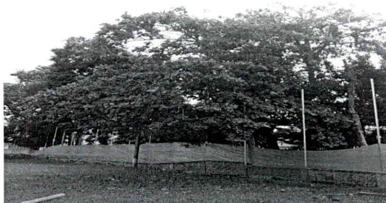
Figura N° 2 Especie ALMENDRO localizado en el lote de terreno