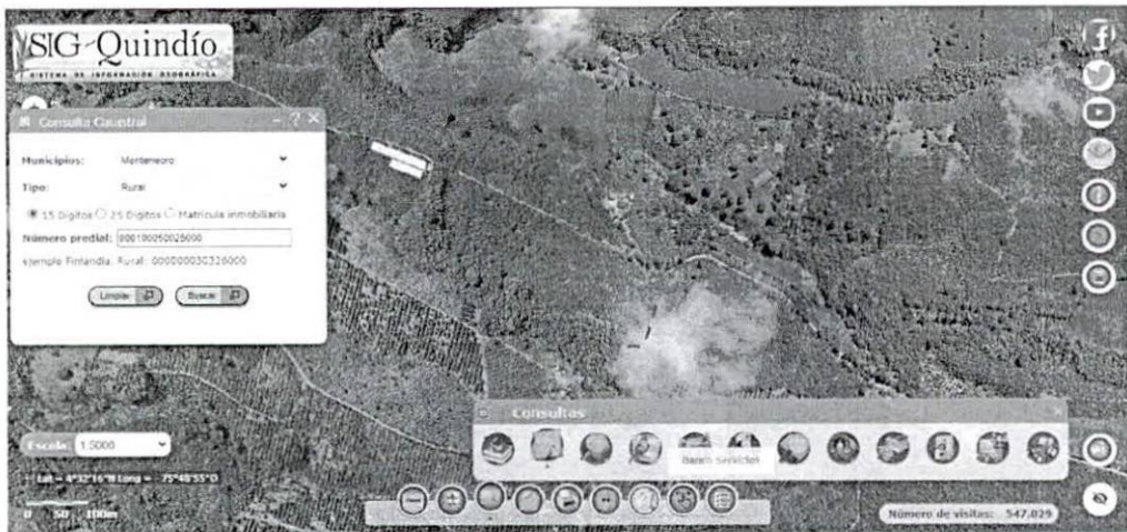
Consulta Predial SING QUINDIO 2023. LOS LAURELES.

CONCEPTO TÉCNICO - SRCA-OF-876 DEL 04/12/2023