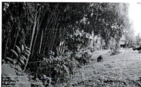
Fotografía 6. Perfil del guadual