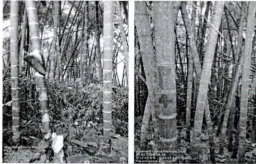
Fotografía 3 Y 4. Verificación de la ubicación de las parcelas y el inventario forestal.