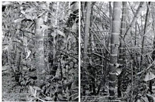
Fotografía 1 Y 2. Verificación de puntos de levantamiento planimétrico en el guadual.