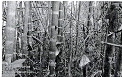
Fotografía 5. Perfil del guadual