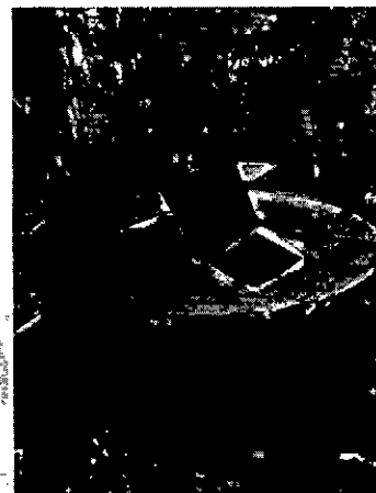
Tanque de almacenamiento