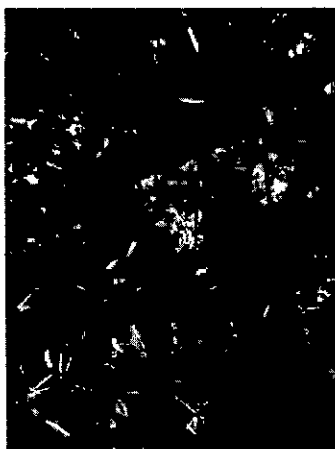
Captación manantial 1

La captación se realiza por medio de tubería y represa natural en el nacimiento, que ingresa a tanque plástico del cual se realiza el bombeo al predio para su aprovechamiento. En la solicitud se propone una segunda captación desde otro manantial del cual se propone captar el agua al tanque por medio de instalación de tubería de manera directa.