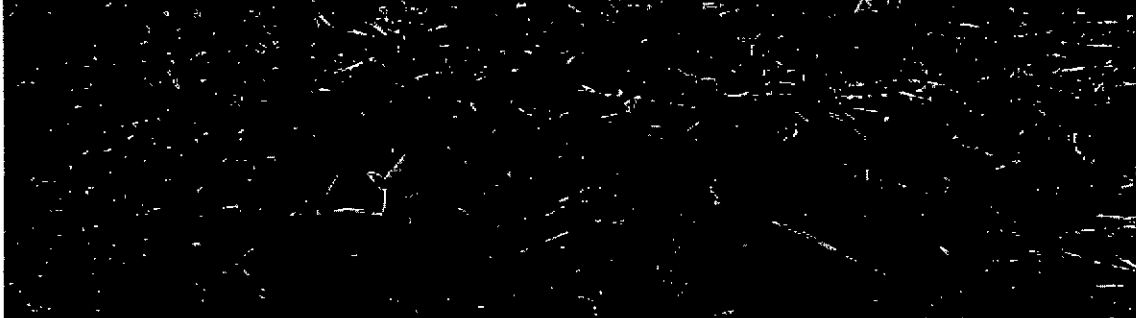
Fotografía 1. Captación del sistema

La captación se realiza de manera directa a través de succión directa en el cauce, el agua es bombeada hasta los reservorios en el predio para aprovechamiento del agua.