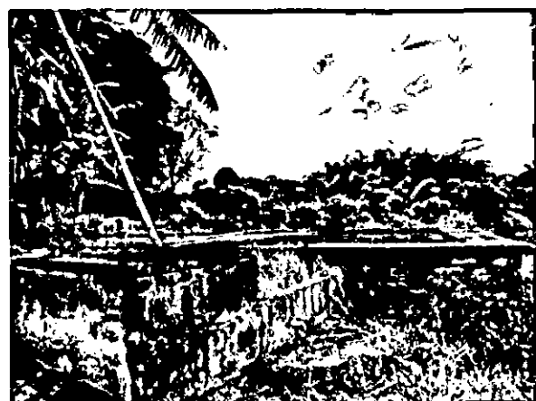
Foto 2. Almacenamiento en Concreto