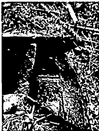
Foto 1. Captación Quebrada Innominada El Cedrito

La captación se realiza a través de bocatoma lateral, estructura en concreto, que aduce el agua mediante manguera de diámetro de 4" y se reduce a 2", hasta tanque de almacenamiento en concreto y de allí se bombea a tanques de almacenamiento con capacidad de 9.000 litros.