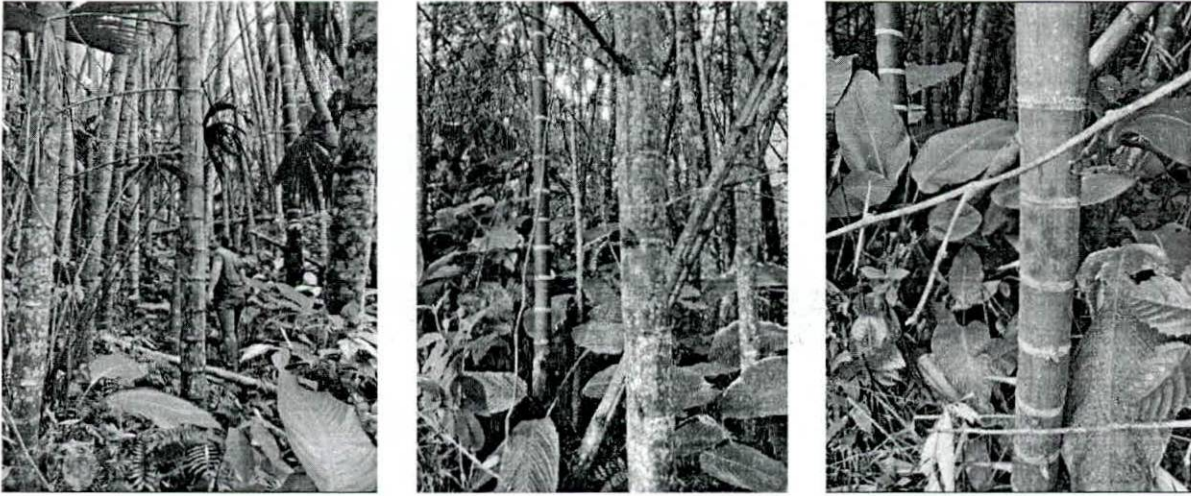
Fotografía 3 y 4. verificación de puntos de levantamiento planimétrico en el guadual.