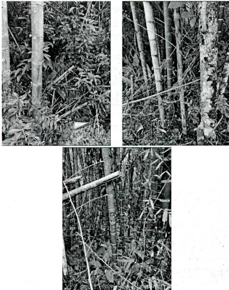
Fotografía 5. verificación de puntos de levantamiento planimétrico en el guadual.