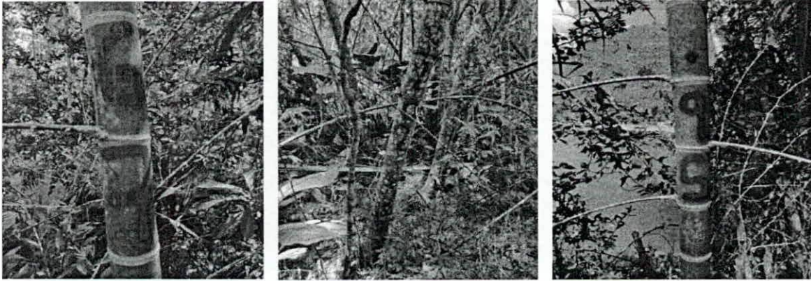
Fotografía 7, 8 Y 9. verificación de puntos de levantamiento planimétrico en el guadual.