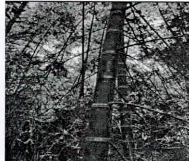
Fotografía 1, 2 Y 3. verificación de puntos de levantamiento planimétrico en el guadua.