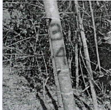
Fotografía 4, 5 Y 6. verificación de puntos de levantamiento planimétrico en el guadua.