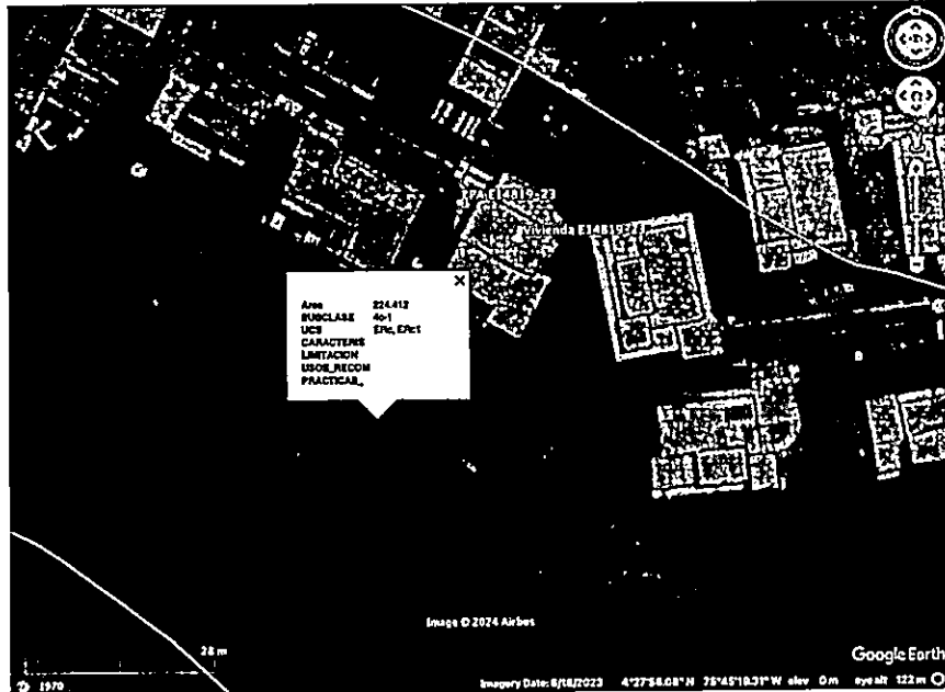
Imagen 2. Capacidad de uso de suelo en la ubicación del vertimiento

POR MEDIO DEL CUAL SE OTORGA UN PERMISO DE VERTIMIENTO DE AGUAS RESIDUALES DOMÉSTICAS PARA UNA VIVIENDA CONSTRUIDA EN EL PREDIO VI QUE CONDUCE CORREG EL CAIMO A LA GLORIETA DEL CLUB CAMPESTRE LT TREINTA Y DOS 32 COND BAMBASU, VEREDA MURILLO MUNICIPIO DE ARMENIA PARA LO CUAL LA CONTRIBUCIÓN DE AGUAS RESIDUALES DEBE SER GENERADA HASTA POR CUATRO (04) CONTRIBUYENTES PERMANENTES Y CUATRO (04) CONTRIBUYENTES TEMPORALES SE ADOPTAN Y SE ADOPTAN OTRAS DISPOSICIONES"