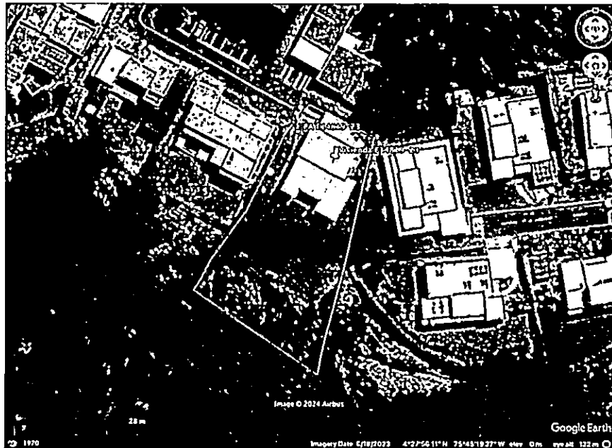
Imagen 1. Localización del vertimiento