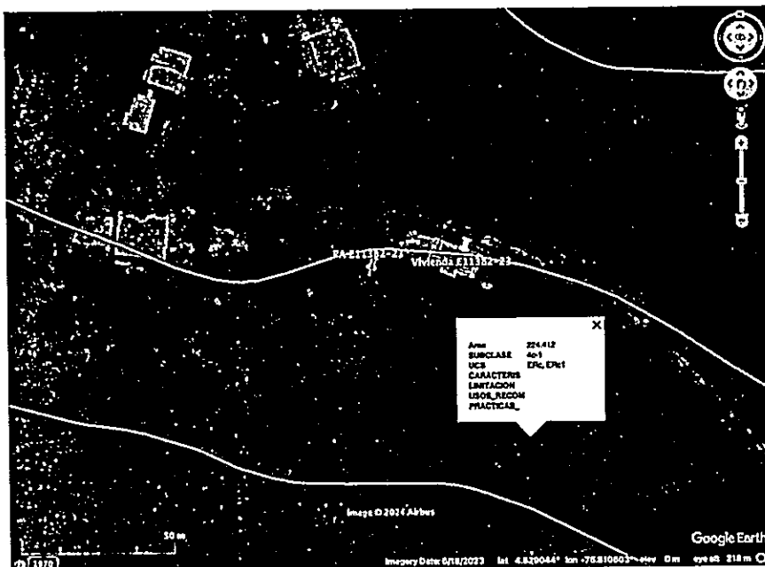
Imagen 2. Capacidad de uso de suelo en la ubicación del vertimiento

Según lo observado en Google Earth Pro, se evidencia que el punto de descarga se encuentra por fuera de polígonos de Suelos de Protección Rural y de Áreas y Ecosistemas Estratégicos. Además, se evidencia que dicho punto se encuentra ubicado sobre suelo con capacidad de uso agrícola 4c-1 (ver Imagen 2). No se observaron nacimientos ni drenajes superficiales en el área de influencia directa de la disposición final.