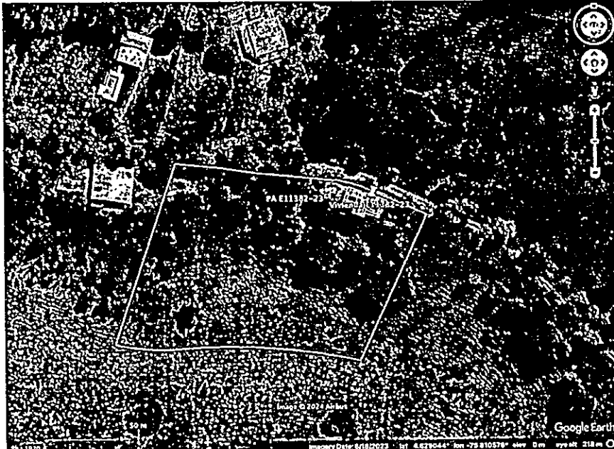
Imagen 1. Localización del vertimiento

"POR MEDIO DEL CUAL SE OTORGA UN PERMISO DE VERTIMIENTO DE AGUAS RESIDUALES DOMÉSTICAS PARA UN LOTE VACIO DONDE SE PRETENDE CONSTRUIR UNA VIVIENDA CAMPESTRE EN EL PREDIO 1) LT BARU LT DE TERRENO 2 UBICADO EN LA VEREDA QUIMBAYA DEL MUNICIPIO DE QUIMBAYA (Q) CON CAPACIDAD HASTA PARA DIEZ (10) CONTRIBUYENTES Y SE ADOPTAN OTRAS DISPOSICIONES"