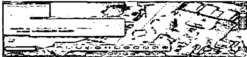
Imagen 1 Ubicación del predio "CARRERA 6 #44 NORTE 10" del municipio de ARMENIA, consulta catastral.

NOMBRE DEL PREDIO: "CARRERA 6 #44 NORTE 10" del municipio de ARMENIA . VEREDA: PARAJE CUCHILLA DEL AGUILA MUNICIPIO: ARMENIA FICHA CATASTRAL: 631900001000600092000 N° MATRICULA: 280-131332 ÁREA: Tiene una extensión de 2500 metros cuadrados.