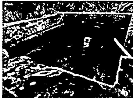
Foto 3. Tanque de Almacenamiento en Concreto