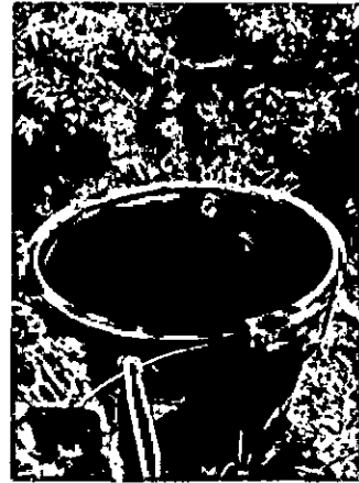
Foto 2. Tanque de Almacenamiento