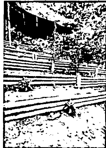
Fotografía 1. Sitio donde se propone la captación del sistema