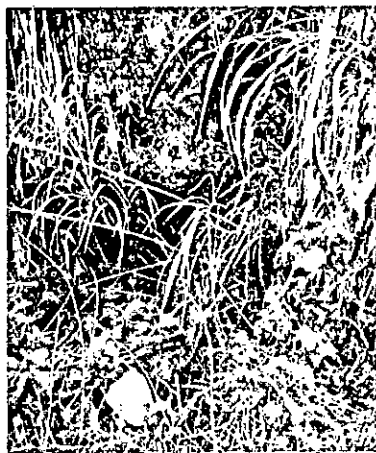
Fotografía 1. Sitios donde se plantean las obras

Se realizó visita al cauce innominado en las que se plantea la construcción de obras de descarga de aguas lluvias. En la siguiente fotografía se presentan los sitios objeto de la visita.