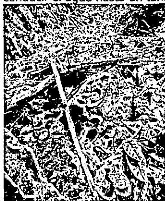
Fotografía 1. Sitio donde se propone la captación del sistema

El sistema de captación propuesto consistirá en instalación de dique artesanal con costales y manguera de 1/2", para conducir el agua hasta un tanque de control, para posterior almacenamiento en tanque tipo australiano capacidad 20000.