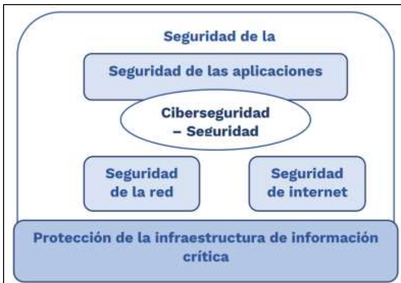
Figura 2. Relación entre la ciberseguridad y otros ámbitos de la seguridad.