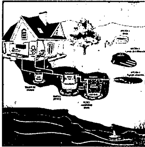
Imagen 1. Esquema corte de Tanque Séptico y FAFa.

percolación obtenida a partir de los ensayos realizados en el sitio es de 4.02 min/pulgada, de absorción media. Se obtiene un área de absorción de 7.92m 2 . La zanja de infiltración tiene como medidas 0.50m de altura y 0.50m con base con una altura total por metro lineal de 1.0m 2 /ml