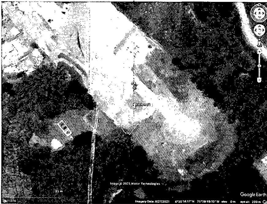
Imagen 1. Localización del vertimiento