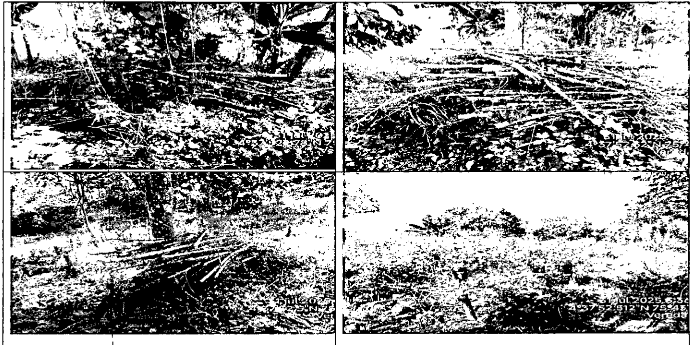
Imágenes 1,2,3 y 4 – Registro fotográfico de los residuos de madera de la zoca de café, ubicados en el predio 1) LA LIBERTAD en la vereda EL PARAISO del Municipio de QUIMBAYA , en el Departamento del QUINDIO , identificado con ficha catastral N° 6327200000000003008200000000 y Matricula Inmobiliaria Nro 284-7 . En un área aproximada de 4.3 hectáreas aproximadamente como consta en el certificado de tradición adjunto a la solicitud.