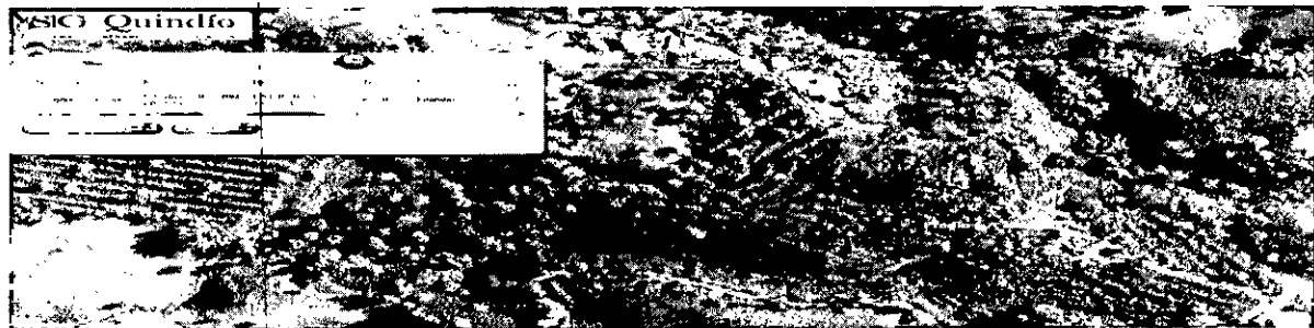
Imagen 5- imagen SIG Quindío de la ubicación del predio 1) LA LIBERTAD en la vereda EL PARAISO del Municipio de QUIMBAYA , en el Departamento del QUINDIO , identificado con ficha catastral N° 6327200000000003008200000000 y Matricula Inmobiliaria Nro 284-7 .