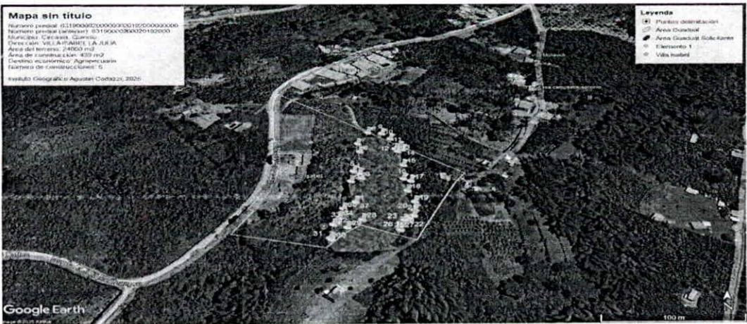
Figura 2. Consulta predial y puntos delimitan guadual de solicitado y dentro del predio. Fuente. GOOGLE EARTH PRO, 2025