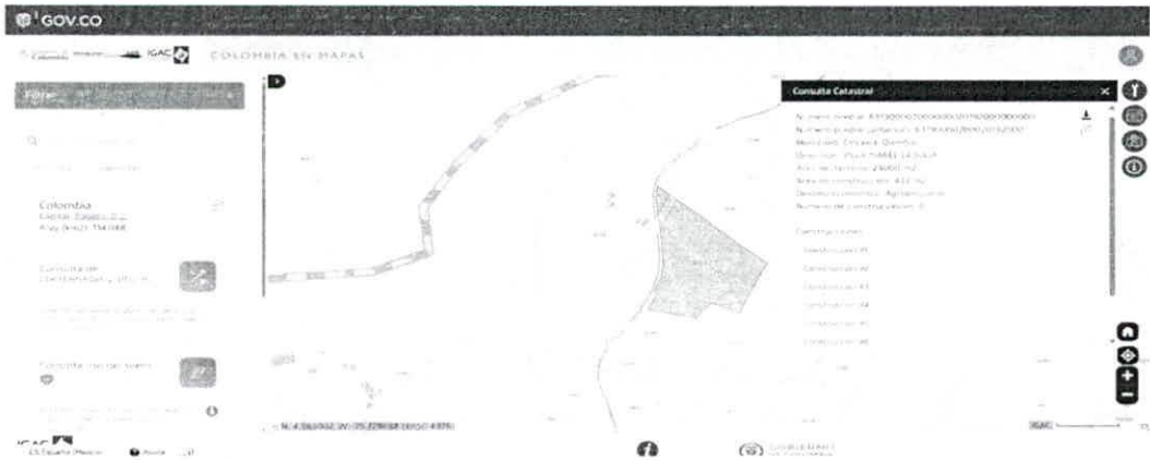
Figura 1. Consulta predial.

Se lleva a cabo la consulta en el GEO-PORTAL DEL IGAC de la ficha catastral que se registra en el certificado de tradición, para realizar la visita técnica y tener identificado plenamente los linderos del predio para no realizar levantamiento del guadual fuera del predio objeto de la solicitud; a continuación, se presenta la evidencia de la consulta realizada en el GEO-PORTAL DEL IGAC como fuente oficial de información predial y el respectivo procesamiento de los puntos tomados en GOOGLE EARTH PRO :