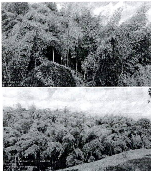
Foto 1 y 2. Vista general del guadual solicitado y asociado con pastos para ganadería.