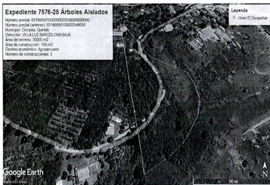
Figura 2. Verificación y ubicación de los puntos tomados en campo de los árboles solicitados.